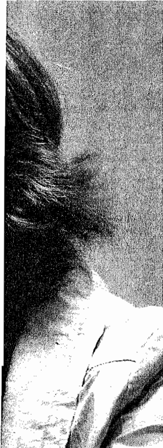
RPO, GRÁFICO: JESÚS G. HINCHADO